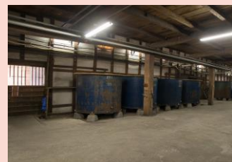
酒蔵内 醸造タンク