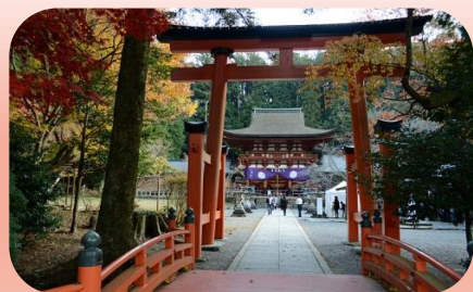
紅葉の丹生都比売神社