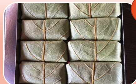
羊子さんの柿の葉寿司